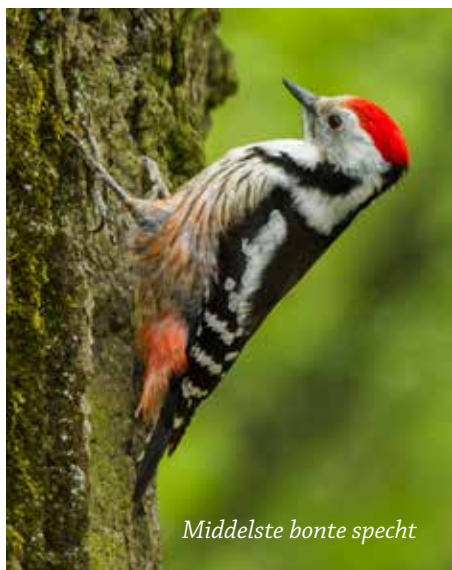
Middelste bonte specht