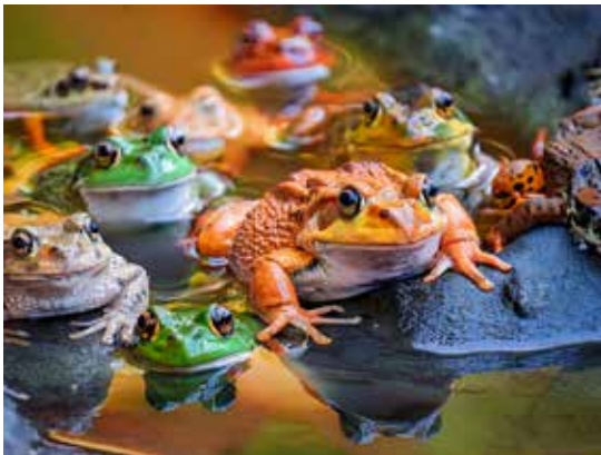
Geen foto's, dan maar door Adobe bedachte plaatjes.

Net als vorig jaar is een deel van de schermen weer gebruikt door Natuurwerkgroep Liempde bij het Hollands Diep in Boxtel. Een ander deel is via Brabants landschap uitgeleend aan de Paddenwerkgroep Vlierden bij Deurne. De vrijwilligers daar hebben dankzij ons materiaal 1896 salamanders, padden en kikkers overgezet naar hun voortplantingswater.