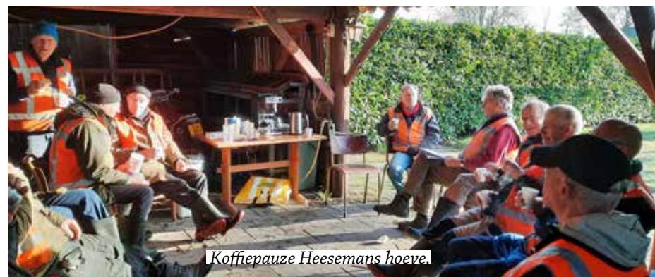
Koffiepauze Heesemans hoeve.

De deelname en werklust was, zoals we eigenlijk wel gewend zijn van onze mensen, enorm goed. Ook de ontvangst op de werkadressen was steeds dik in orde. Warme koffie of thee en heel vaak wat lekkers erbij.