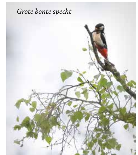
Grote bonte specht