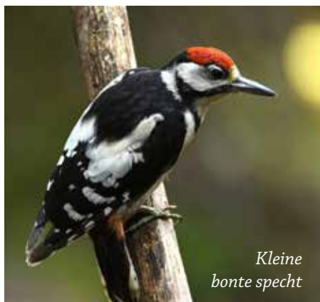
Kleine bonte specht

tegen 18 in 2018), ook de Middelste bonte specht (1) en de Kleine bonte specht (2) waren nog steeds aanwezig. Dat geldt ook voor de Groene specht en de Zwarte