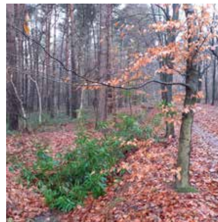
De rododendron is aan het verdwijnen in het Sparrenrijk. Er was in dit seizoen erg veel hoog water.

rond. Er zal nog wat snoeiwerk moeten worden verricht in het rododendronlaantje om een blijvende doorgang te garanderen.