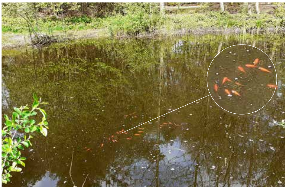
Er waren goudvissen te zien in de poel die daar gedropt zijn.

Door de onderhoudsachterstand opgelopen in de coronaperiode was er nog op veel plekken een flinke verwildering van struiken, begroeiingen en grassen. We konden flink aan de bak en heel het werkjaar heeft de werkgroep met volle overgave en inzet veel werk verzet.