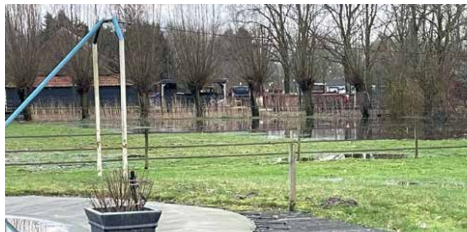
De knotwilgen bij van de Pasch staan in het water.

Aan het eind van het knotseizoen was er zoveel regen gevallen dat we op twee adressen niet hebben kunnen werken vanwege ondergelopen weilanden, waar we nauwelijks konden lopen of waarin we dreigden te verzakken.